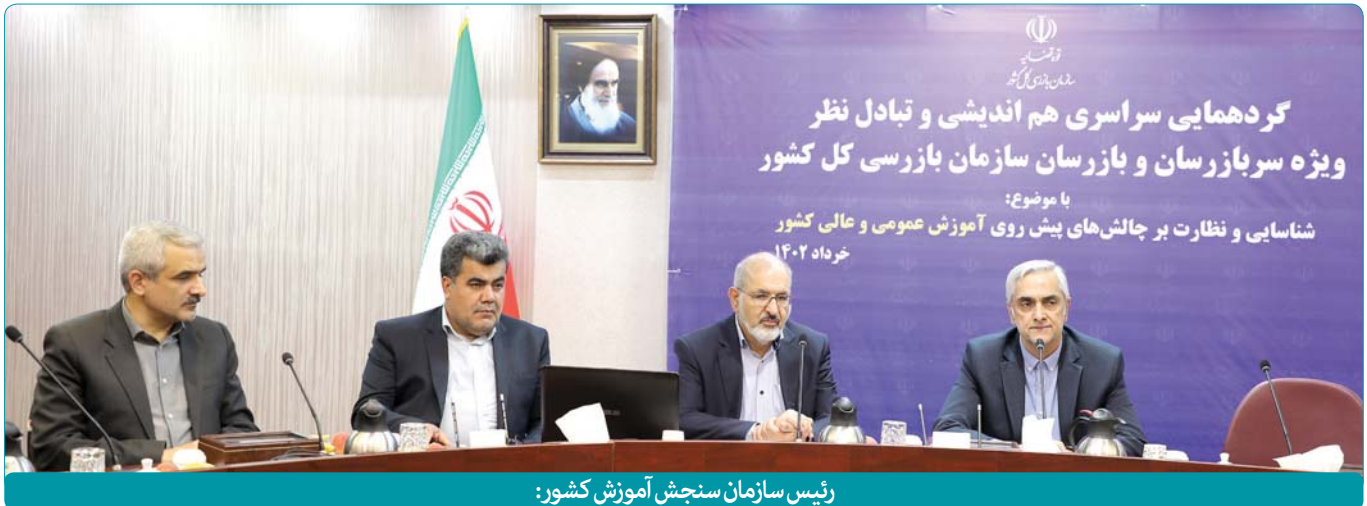
رئیس سازمان سنجش آموزش کشور:

هفته‌نامه خبری و اطلاع‌رسانی سازمان سنجش آموزش کشور • دوشنبه ۲۹ خرداد ۱۴۰۲ • ۱۲ صفحه • شماره پیاپی ۱۳۳۰